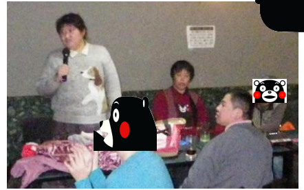
Skさんの相の手に、Nさんも上手に歌えたのではないですか

みなさん、カラオケって大好きなんですね。次々に交代で歌っていたそうです。中には、マイクを離さない人も居たのではないのでしょうか。