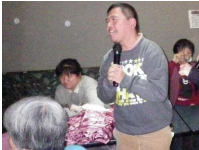
Oさんの熱唱ぶりはいかがですか

つくしグループの苑外活動で、麻生田にあるカラオケ店と焼肉なべしまに出かけました。