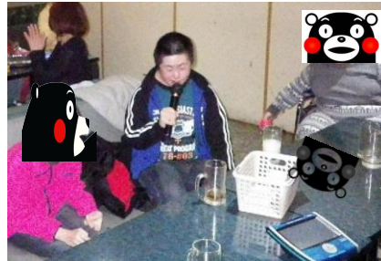
Tさんも、久しぶりの苑外活動を楽しまれましたよ

みなさん、カラオケって大好きなんですね。次々に交代で歌っていたそうです。中には、マイクを離さない人も居たのではないのでしょうか。