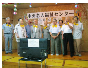
—七夕まつり・ミニ発表会—