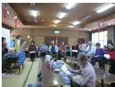
—お楽しみ歌の教室—