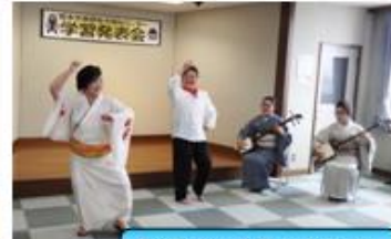
民謡さんの歌と演奏で 牛深ハイヤを所長が語る