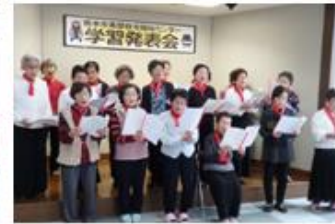
童謡・唱歌クラブ