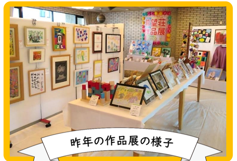
昨年の作品展の様子